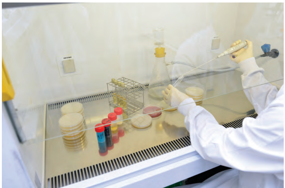
Recherche et développement de nouvelles formulations.

en accompagnant ses clients sur les grands marchés internationaux.