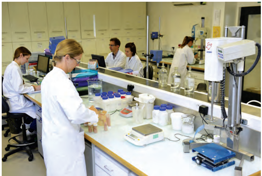
Vue du nouveau laboratoire sur le site de Château Gaillard (Ain).

« Nous sommes conscients des défis de la compétition internationale forte qui se manifeste par exemple dans tous les événements mondiaux de Dubaï à Hongkong, reconnaît-elle. Mais nous constatons également que nous ne sommes pas démunis pour y faire face, grâce à la renommée de nos fabrications made in France et au positionnement résolument qualitatif des produits que nous développons. » Une qualité de production qui est validée par la mise en œuvre de plusieurs certifications apportant « un plus » souvent déterminant à l'export, insiste-t-elle. « Nous sommes en mesure de répondre aux obligations d'enregistrement les plus drastiques exigées par certains pays ». Un service réglementaire s'assure de la conformité des formules et des produits selon les exigences des différents pays de destination. L'entreprise française renforce ainsi son développement à l'export