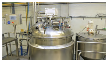
Mise en production.

ISO 9001 et ISO 13485 et l'agrément produits OTC Canada. La certification ISO 9001 définit les exigences de la mise en place d'un système de management qualité. « Cela garantit une traçabilité certaine aux produits fournis et un gage de qualité pour nos clients. » La certification ISO 13485 définit les exigences d'un système de management qualité dédié aux dispositifs médicaux. Alpol Cosmétique est désormais qualifié pour proposer ce type de produits.